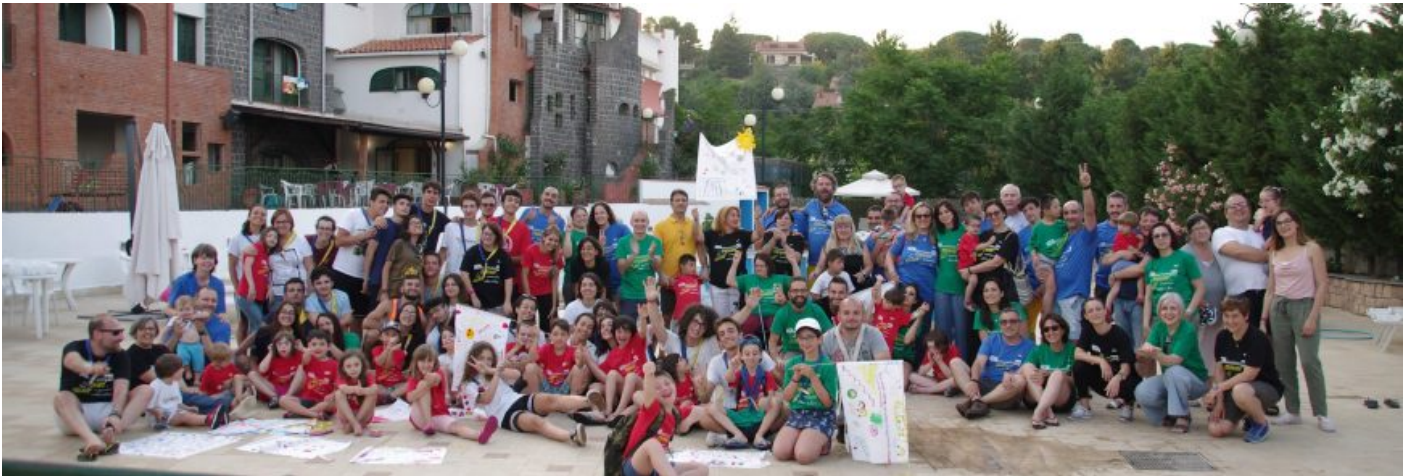
La meravigliosa famiglia di Vita21