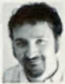
paolo franzese/web design