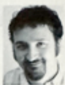
paolo franzese/web design