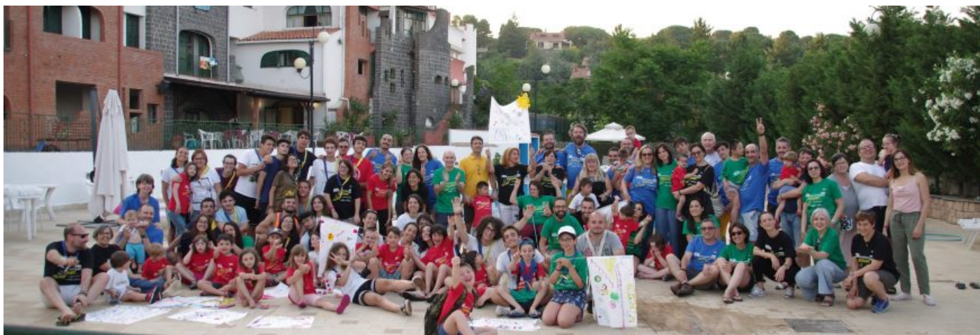
La meravigliosa famiglia di Vita21