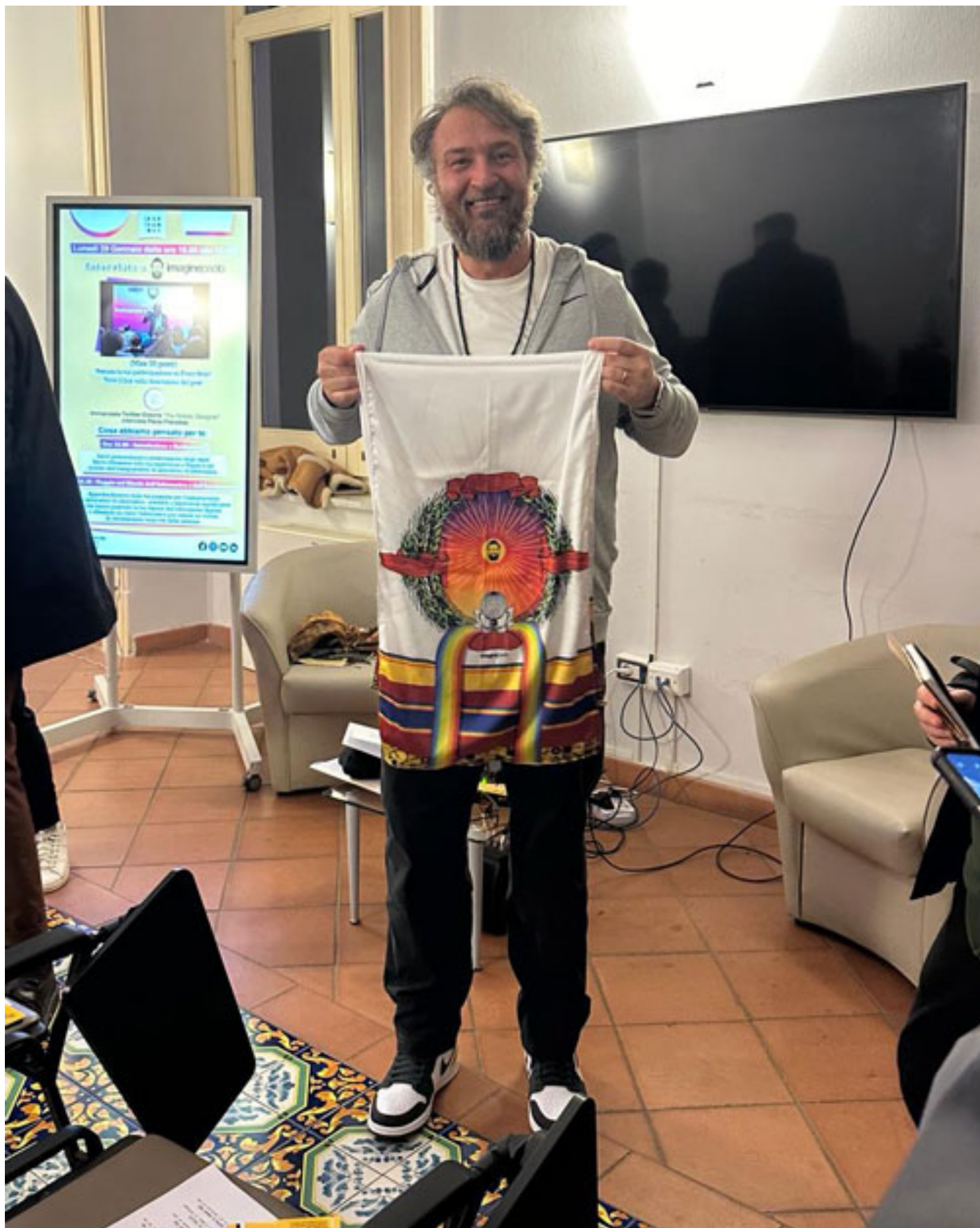
La sciarpa di imaginepaolo presenza