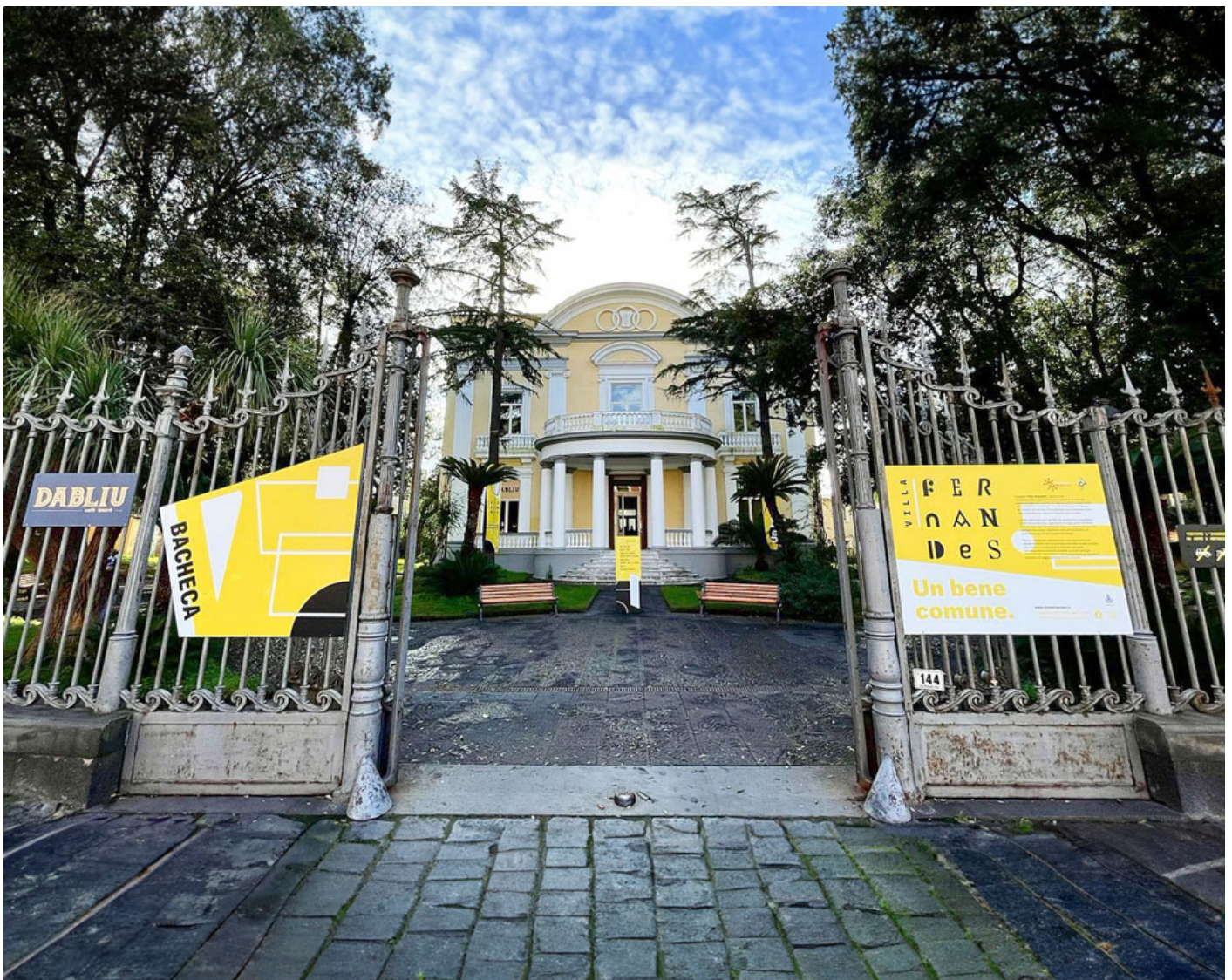
Villa Fernandes , un edificio dei primi del '900 nel cuore di Portici.

Il progetto Villa Fernandes , sostenuto con vigore dalla Fondazione CON IL SUD e la Fondazione Peppino Vismara , e promosso dalla cooperativa sociale Seme di Pace ONLUS insieme alla Città Portici e altri 22 partner attivi sul territorio, rappresenta un esempio luminoso di rigenerazione urbana e sociale.