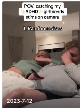
Number 6 counts right? 😂😂 #adhdrelationships... tarah.and.b... ▶ 4.5M

In crescita i video su TikTok, per descrivere sintomi ed eventuali autodiagnosi