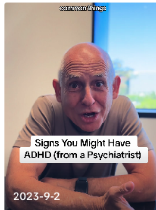
Do you have any of these? #ADHD docamen ▶ 3.6M