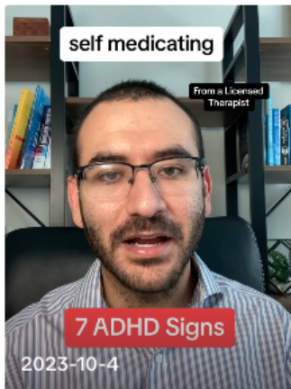
7 Subtle Signs of ADHD. #adhd #adhdtiktok... therapytoth... ▶ 2.2M