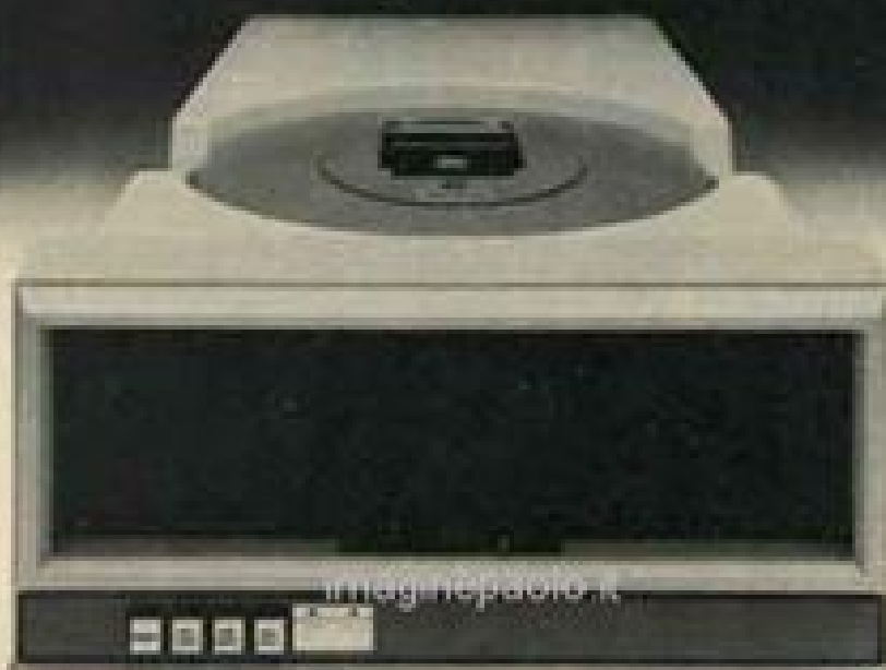
5440-12 Top Load Drive

* Factory rebuild 10MB cartridge disk drive only A new Census Data Systems controller is available for $1,495 $4,495 for a brand new Ampex 10MB drive only