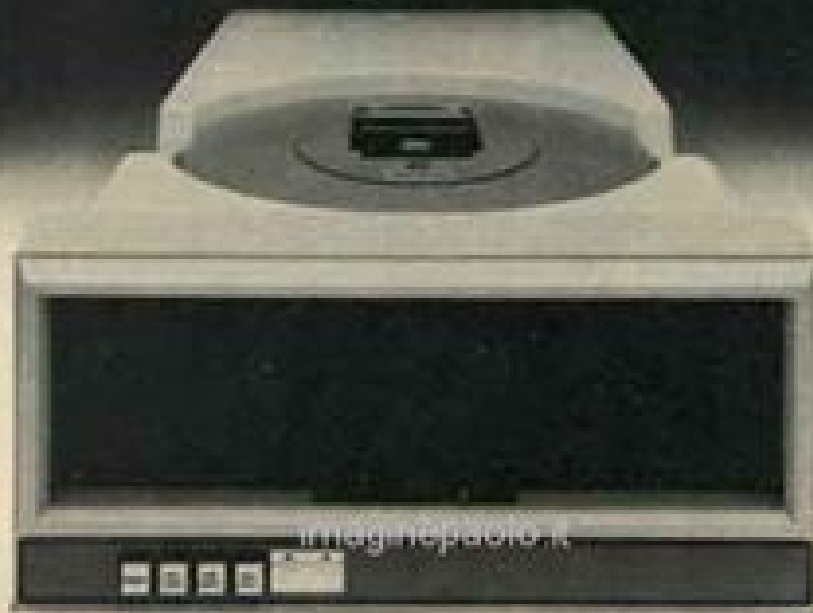
540-12 Top Load Drive

* Factory rebuild 10MB cartridge disk drive only