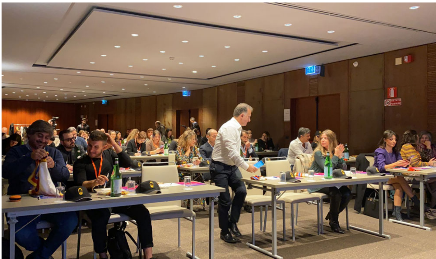
Sala Cervantes D'Angiò del N.H. Hotel Panorama a Napoli in via Medina.

È domenica 20/11/2022 e non a caso siamo alla decima edizione: