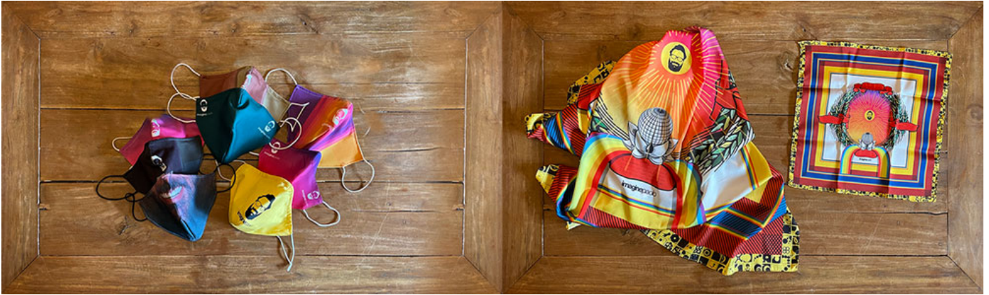
Mascherine, foulard e fazzoletto da taschino.

La prima strategia che userei per avere successo con Print On Demand e con zero euro per iniziare è usare il pubblico che già hai (nei miei seminari parlo delle 3F):