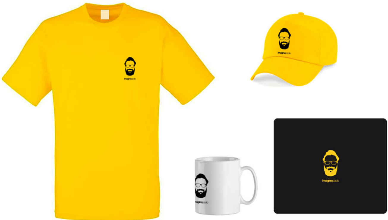
T-Shirt, tazza, cappello, mouse-pad.

Tutti prodotti stampati con un logo o qualsiasi tipo di personalizzazione e ovviamente tutto questo può essere venduto a chi ne fosse eventualmente interessato. Puoi fare un sacco di soldi in questo modo perché puoi vendere una quantità illimitata di capi di abbigliamento, o gadget senza averli pagati in anticipo.