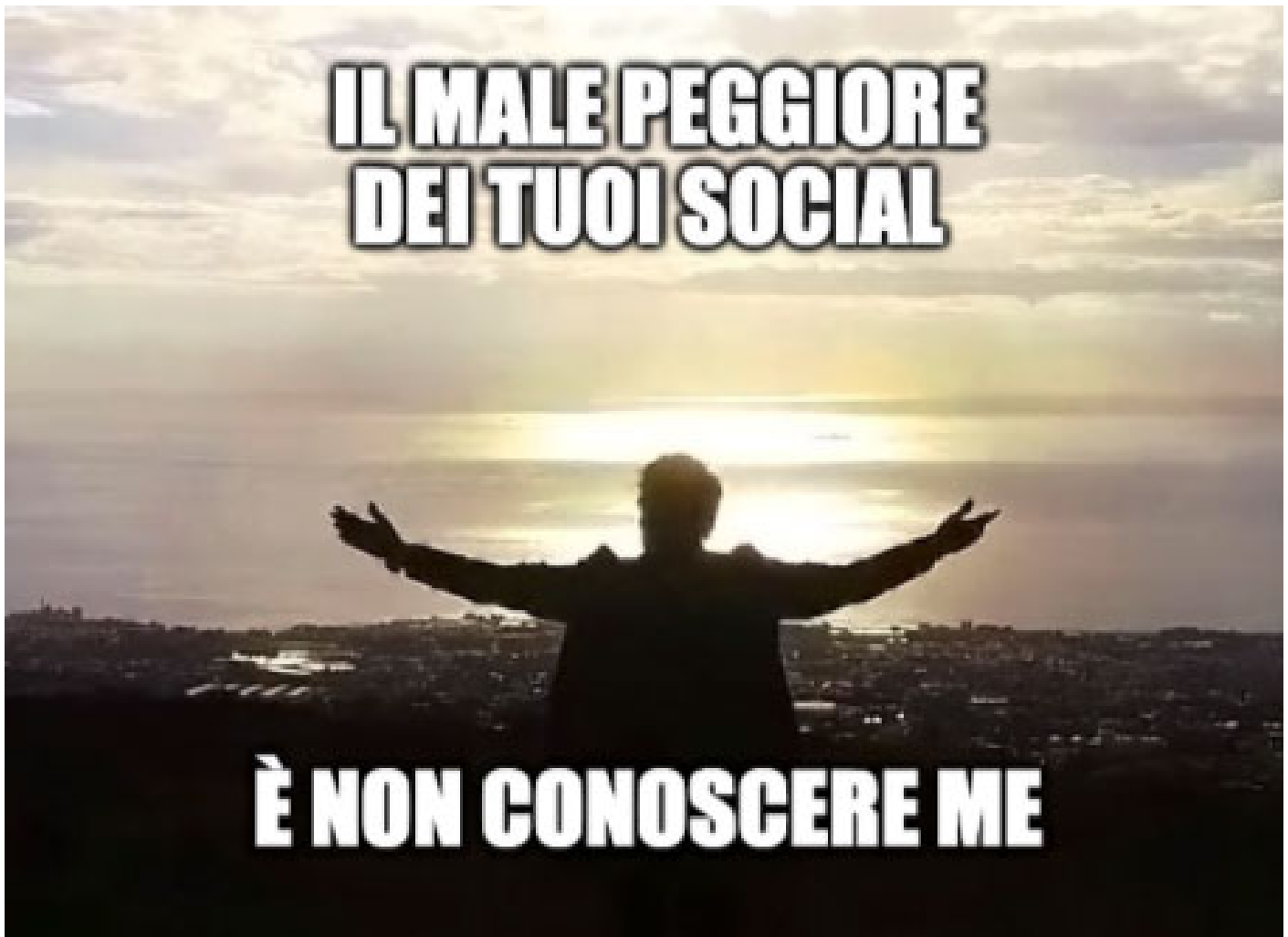
Immagine creata con un “meme generator”.