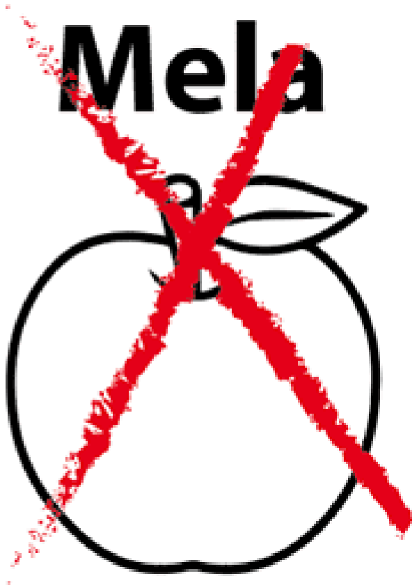
Non fare questo