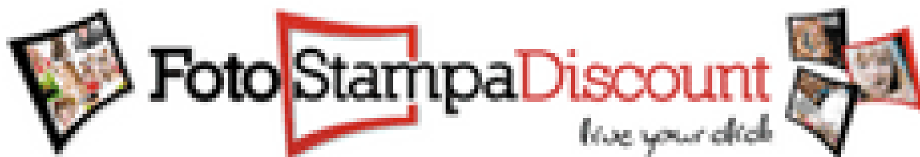
Foto Stampa Discount

Fotostampadiscout è una azienda italiana che crea dalle tue foto calamite di diverse forme, stampate su uno speciale foglio magnetico A4 e ritagliate in forme differenti. Una simpatica idea per personalizzare un cadeau, una bomboniera, per pubblicizzare la propria attività, o semplicemente per tappezzare il vostro frigo con i ricordi più belli.