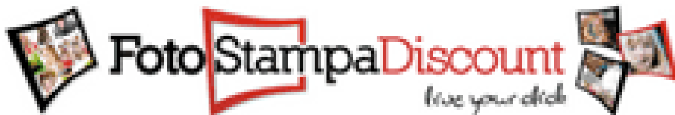
Foto Stampa Discount

Fotostampadiscout è una azienda italiana che crea dalle tue foto calamite di diverse forme, stampate su uno speciale foglio magnetico A4 e ritagliate in forme differenti. Una simpatica idea per personalizzare un cadeau, una bomboniera, per pubblicizzare la propria attività, o semplicemente per tappezzare il vostro frigo con i ricordi più belli.