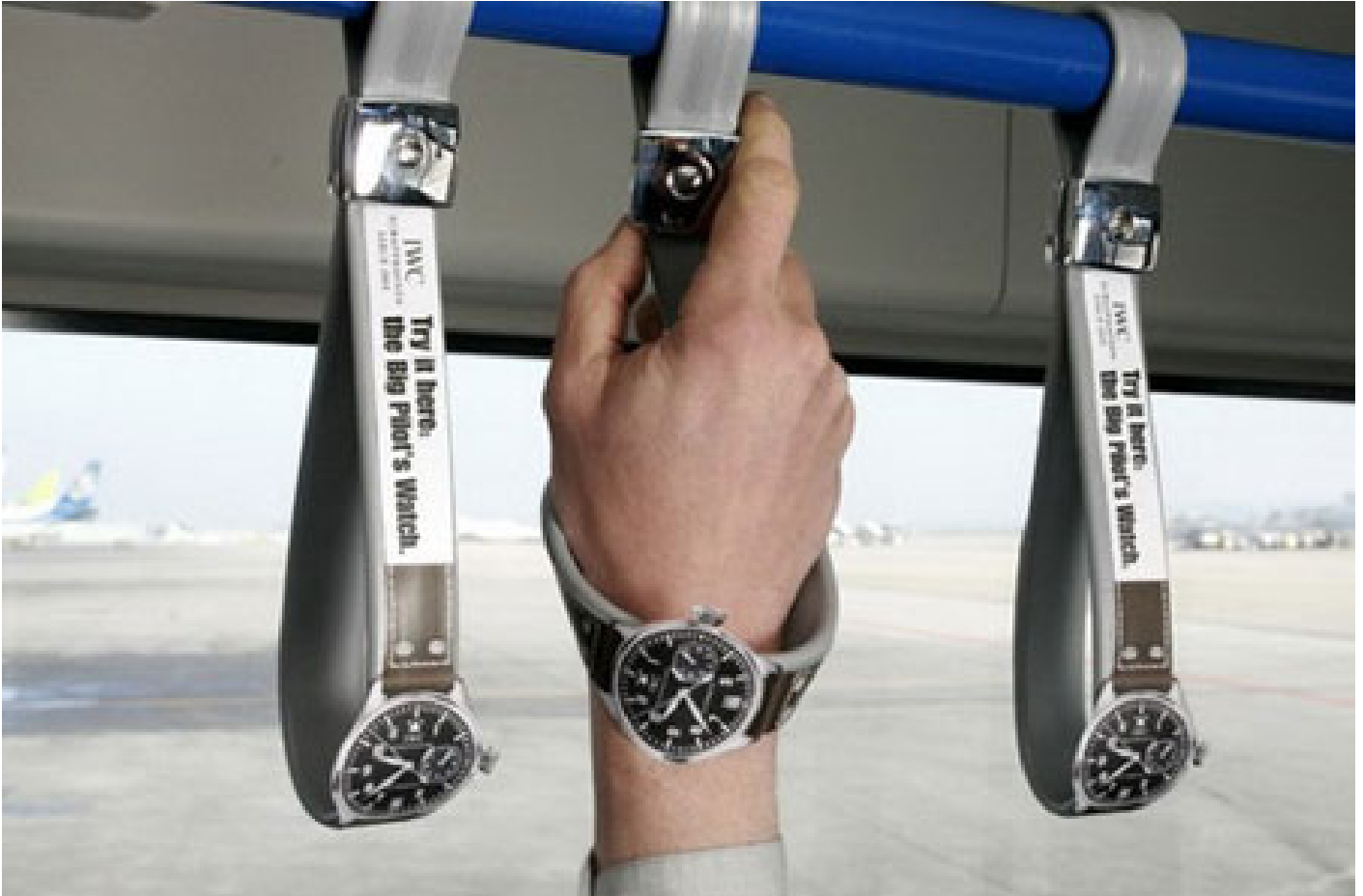
(Ambient adv proposto da IWC per pubblicizzare "Big Pilot Chrono")

Questa tipologia di advertising al giorno d'oggi dove i media e il web sembrano avere il sopravvento su tutto, sembra che riesca a coinvolgere i possibili stakeholder in un modo più diretto. Infatti, questo tipo di campagna pubblicitaria non obbliga il cliente alla ricerca di un determinato prodotto tramite i soliti mezzi di comunicazione convenzionali, come la tv, riviste e siti web, ma l'ambient advertising s'interpone tra il cliente e la sua vita quotidiana, coinvolgendolo in prima persona.