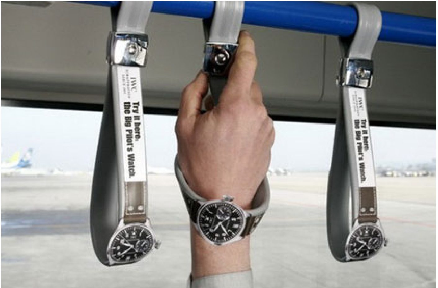
(Ambient adv proposto da IWC per pubblicizzare "Big Pilot Chrono")

Questa tipologia di advertising al giorno d'oggi dove i media e il web sembrano avere il sopravvento su tutto, sembra che riesca a coinvolgere i possibili stakeholder in un modo più diretto. Infatti, questo tipo di campagna pubblicitaria non obbliga il cliente alla ricerca di un determinato prodotto tramite i soliti mezzi di comunicazione convenzionali, come la tv, riviste e siti web, ma l'ambient advertising s'interpone tra il cliente e la sua vita quotidiana, coinvolgendolo in prima persona.